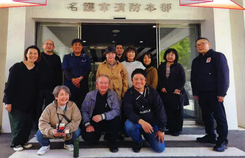
今回視察研修に参加した皆様