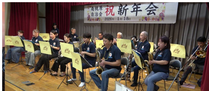
北谷ウインド・オーケストラ