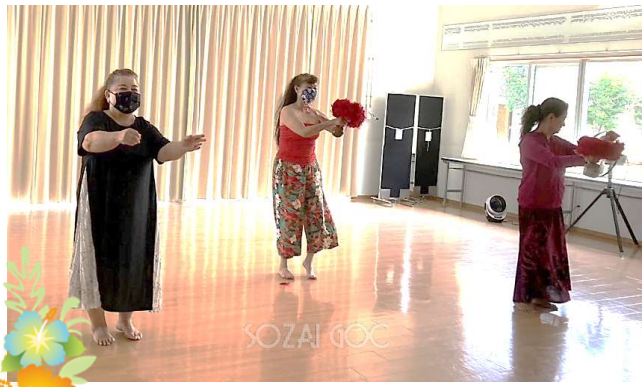
フラサークルアロアロ