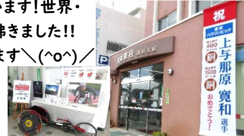
↑南桃原公民館 玄関前の掲示♪