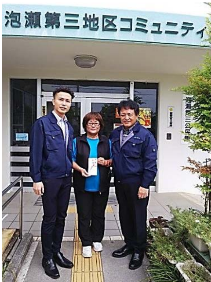
(株)設備技研より寄付

大第サ場育技員 変三ーあ成研ー1 感自トし資さ様1 謝治をび金んよ/ い会開な造はり2 たに催ー成十寄0 しも。にのー付(株) ま寄収て一月が設 す付益チ環三あ備 。し金ヤで日り技 てのリ沖青し(賛 頂一テ市少た。助 まをー民年。助 し泡コ小健設会 た瀬ン劇全備