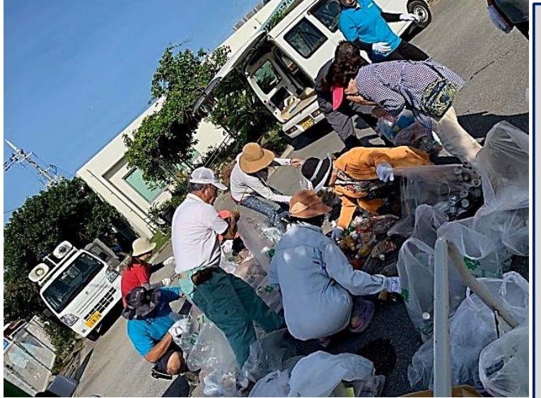
クリーンデー in 沖縄市

わ機参0たトど会日 っ会加袋。ボにで(≡ てをがの公トボも日ク い利増成民ルイ6ーに く用え果館な捨0にク としてが駐どて名開 良てきあり車をさの余催 い子まり場拾れたのされ でもたし種集缶の加、 すもたし類め・が泡 ね達。た分てビリン第 。がい。親別き・ま・道 地ろ親子、ま・約し へろで約し 関なの5ッな治0